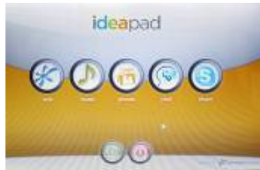
Lenovo Quick Start