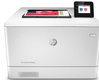
Impresora HP LaserJet Pro a color M454dw

Impresora con seguridad dinámica habilitada. Para ser exclusivamente utilizada con cartuchos que utilicen un chip original de HP. Es posible que no funcionen los cartuchos que no utilicen un chip de HP, y que los que funcionan hoy no funcionen en el futuro. Obtenga más información en: http://www.hp.com/go/learnaboutsupplies